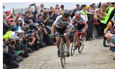
Philippe GILBERT (Belge), Vainqueur Paris-Roubaix 2019